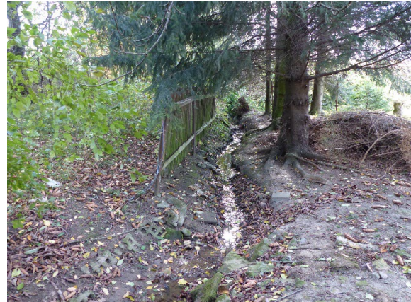
Schmaler Wasserlauf entlang der westlichen Plangebietsgrenze