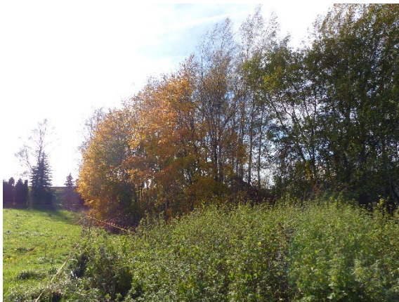
Gehölgürtel, dominierend Ahorn und Birke