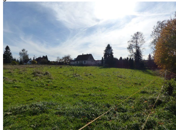
Grünlandfläche, zeitweise extensiv beweidet

Das Umfeld des Plangebietes ist hauptsächlich durch Einfamilienhausstandorte geprägt, welche nördlich, östlich und südlich angrenzen. Westlich des Plangebietes befinden sich einige Lager- und Werkshallen, darunter ein Obst- und Gemüsehandel.