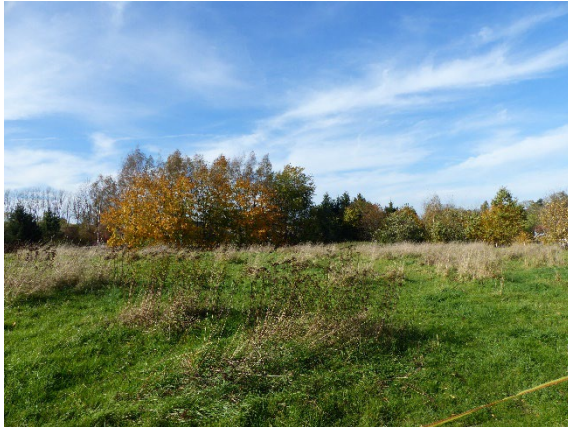
Extensiv-Grünland mit Gehölgürtel im Hintergrund